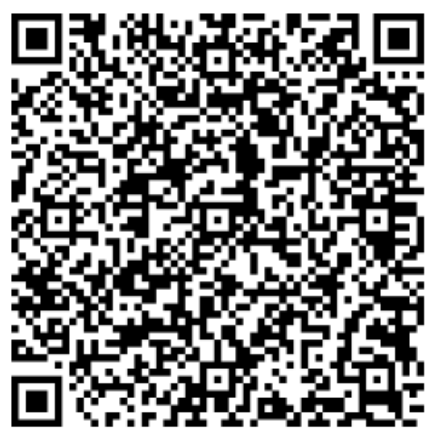
Cliquer ici pour ouvrir la carte de membre